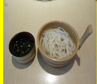
釜揚げうどん(温) 小290円 中370円 大450円