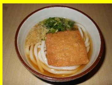
きつねうどん(温冷) 小370円 中450円 大530円

その他、「明太子」「わかめ」「焼きチーズ」等のトッピングで自分だけの「オリジナル」のうどんが楽しめます。