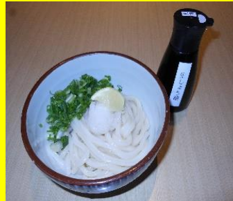
生醤油うどん(温冷) 小280円 中360円 大440円