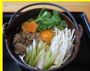
鍋焼きうどん(温) 冬季限定 小640円 中720円 大800円