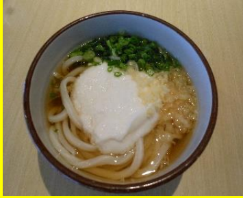
山かけうどん(温冷) 小380円 中460円 大540円