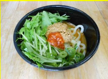
担担うどん(温冷) 夏季限定 小560円 中640円 大720円