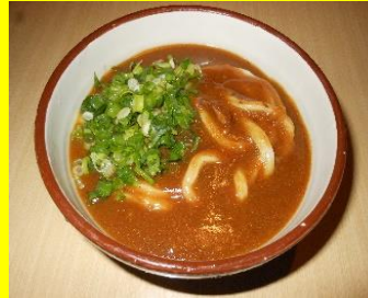
牛スジカレーうどん(温) 小490円 中570円 大650円