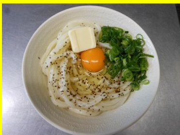
釜玉バターうどん(温) 小420円 中500円 大660円