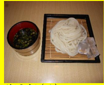
ざるうどん(冷) 小280円 中360円 大440円