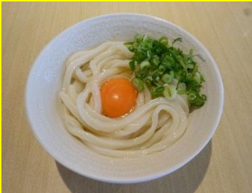
釜玉うどん(温) 小340円 中420円 大500円