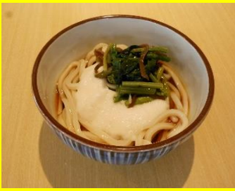
山菜とろろうどん(温冷) 小500円 中580円 大660円