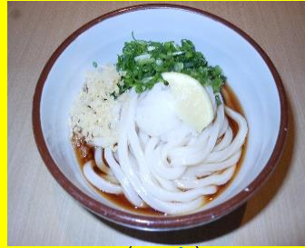
ぶっかけうどん(温冷) 小280円 中360円 大440円