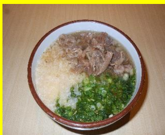
肉うどん(温) 小570円 中650円 大730円